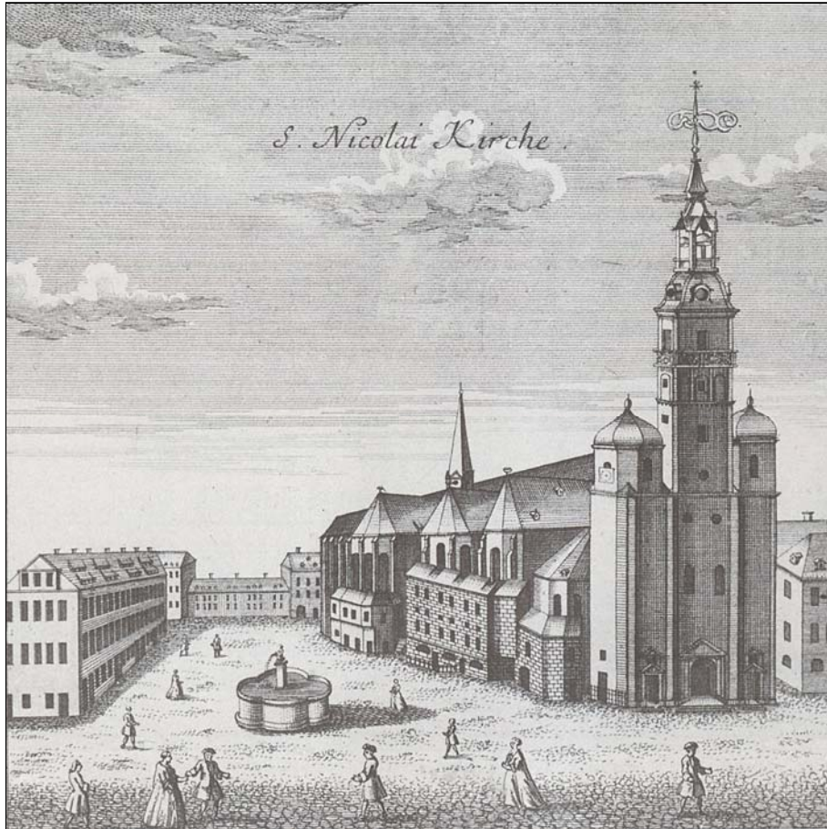
In der Nikolai-Kirche in Leipzig wurde am 4. April 1724 die Johannes-Passion uraufgeführt.

und sinnlichem Wohlbehagen für Bach nicht ungewöhnlich und für die pietistische Frömmigkeit sogar charakteristisch. „Aber es ist doch bemerkenswert, wie selbstverständlich Bach in einem Stück, dessen Tonart f-Moll laut Johann Mattheson ‚Verzweiflung, tödliche Herzens-