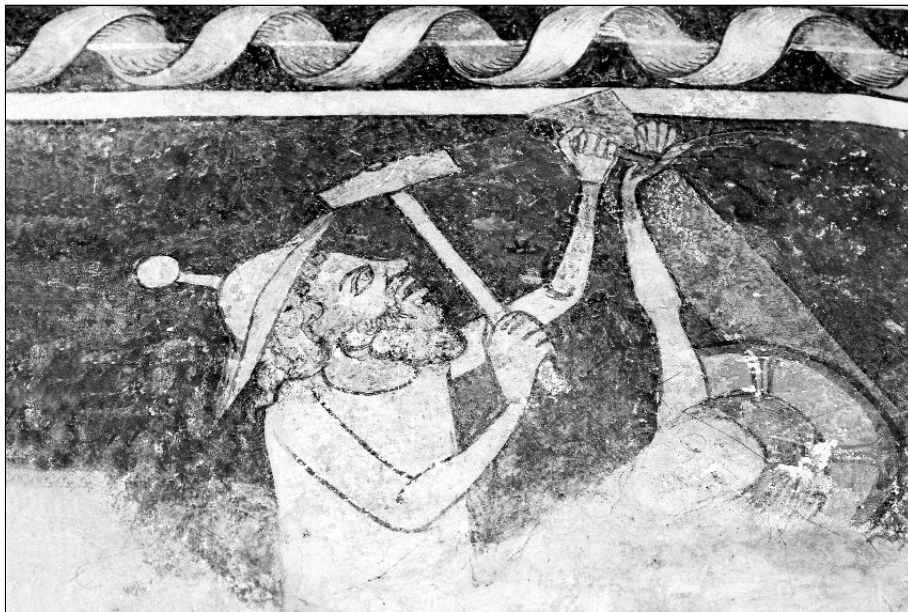
Detail der Wandmalerei in der Katharinen-Kapelle in Landau (um 1350): Mit einem mächtigen Hammer treibt ein Scherge Jesu einen Nagel durch die Hand. Der Mann mit einer das Böse schlechthin verkörpernden Erscheinung trägt einen auffälligen Hut, wie ihn im Spätmittelalter die Juden tragen mussten. Das Werk entstand zu einer Zeit, als die Pest schätzungsweise 25 Millionen Menschen (ein Drittel der damaligen europäischen Bevölkerung) dahinraffte und die ohnehin als Gottesmörder diffamierten Juden als Brunnenvergifter auch für den schwarzen Tod verantwortlich gemacht wurden.

Der christliche Antijudaismus belastet auch die Geschichte der Passionsvertonung. Seit dem 13. Jahrhundert werden im mehrstimmigen Passionsgesang die Worte der Juden